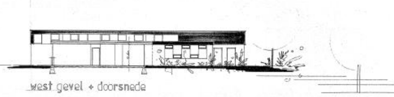
west gevel + doorsnede